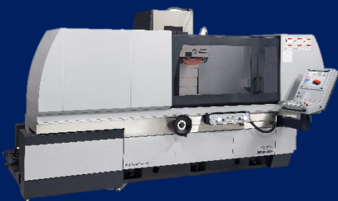
NC平面研削盤 CA1シリーズ