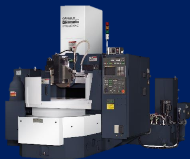
ロータリー研削盤 PRGシリーズ