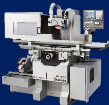
成形研削盤 PFG/HPGシリーズ