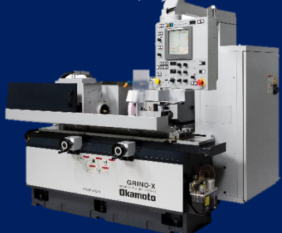
円筒・内面研削盤 OGM/IGMシリーズ