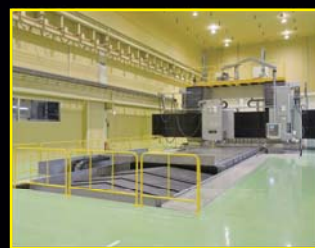
高い精度要求に応える 恒温ブース