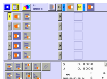
文字レスタッチパネル